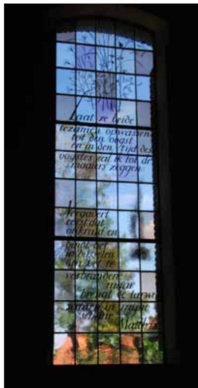
Kerkeam van Schoorse kerk