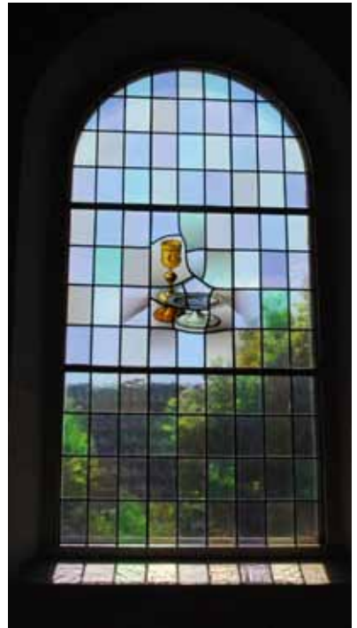
Kerkrans van Hansweertse kerk

Na de gebeden wordt het slotlied gezongen waarna de voorganger de zegen uitspreekt, letterlijk door de gemeente beaamd in het gezongen 'Amen'.