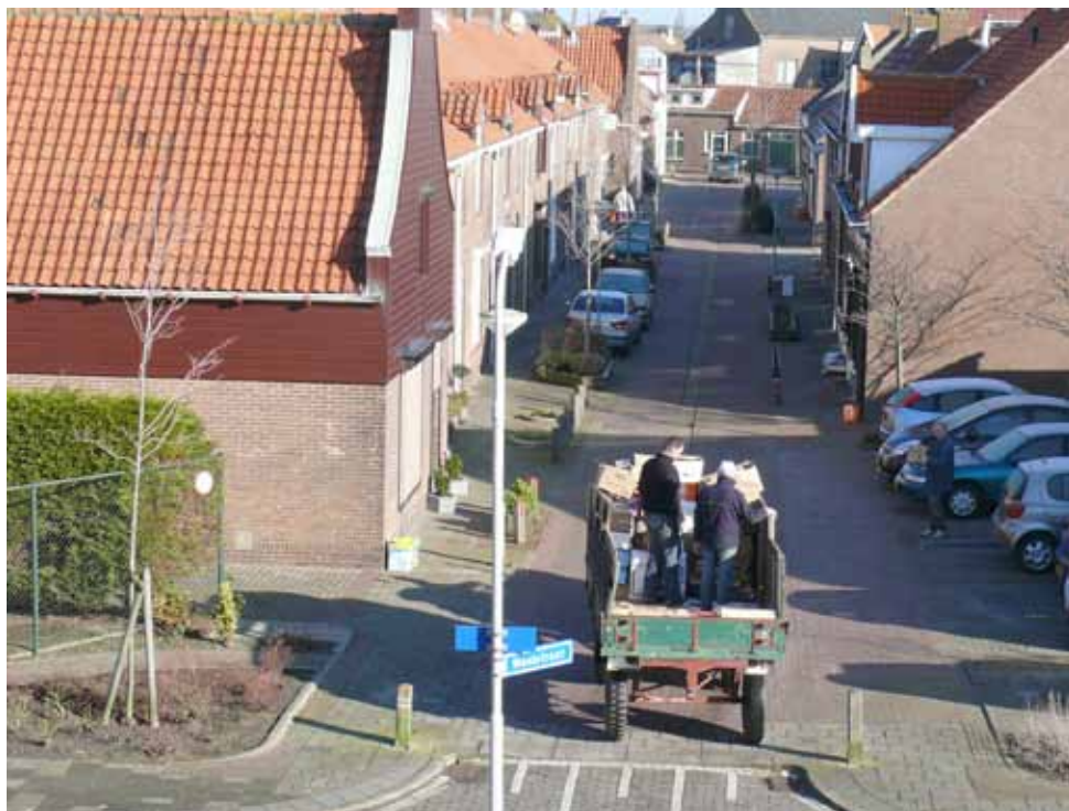
Ophalen van oud papier in Hansweert op iedere 2e zaterdag van de maand