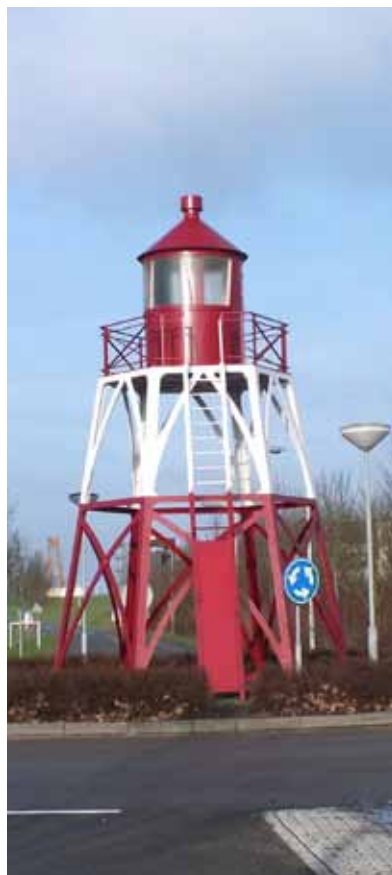
Voormalig sectorlicht De Punt op het grensgebied tussen Hansweert en Schore